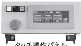
タッチ操作パネル Touch Panel