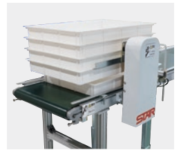
段ばらしユニット